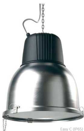
Easy C (IP65)