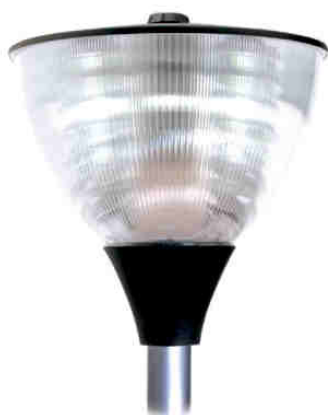
● Negro forja / Forge Black - Base

Luminaria para alumbrado ambiental. Se puede aplicar en calles, parques y jardines así como zonas residenciales. Admite equipos y lámparas de descarga de hasta 250w.